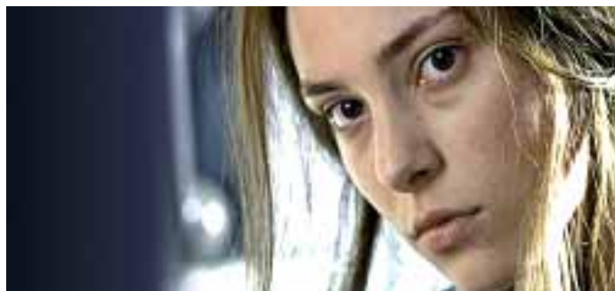
Da/Aus La meglio gioventù

tori italiani contemporanei sono più che mai creativi e produttivi, dall'altra solo pochissimi dei loro film trovano un distributore tedesco e riscuotono così poca eco nel paese. Tra le poche eccezioni si annoverano Pane e Tulipani („Brot und Tulpen“) di Silvio Soldini, che ha riscosso per giunta un notevole successo, e film passati invece piuttosto in sordina come Fuori dal mondo („Nicht von dieser Welt“) di Giuseppe Piccioni, La stanza del figlio („Das Zimmer meines Sohnes“) di Nanni Moretti, Le fate ignoranti („Die Ahnungslosen“) di Ferzan Ozpetec e Respiro di Emanuele Crialeses, uscito in Germania con il titolo „Lampedusa“. Non ci resta che augurare ampi consensi a I cen-