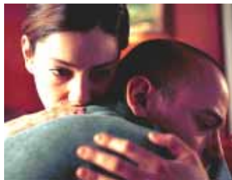
Da/Aus La finestra di fronte

tori italiani contemporanei sono più che mai creativi e produttivi, dall'altra solo pochissimi dei loro film trovano un distributore tedesco e riscuotono così poca eco nel paese. Tra le poche eccezioni si annoverano Pane e Tulipani („Brot und Tulpen“) di Silvio Soldini, che ha riscosso per giunta un notevole successo, e film passati invece piuttosto in sordina come Fuori dal mondo („Nicht von dieser Welt“) di Giuseppe Piccioni, La stanza del figlio („Das Zimmer meines Sohnes“) di Nanni Moretti, Le fate ignoranti („Die Ahnungslosen“) di Ferzan Ozpetec e Respiro di Emanuele Crialeses, uscito in Germania con il titolo „Lampedusa“. Non ci resta che augurare ampi consensi a I cen-