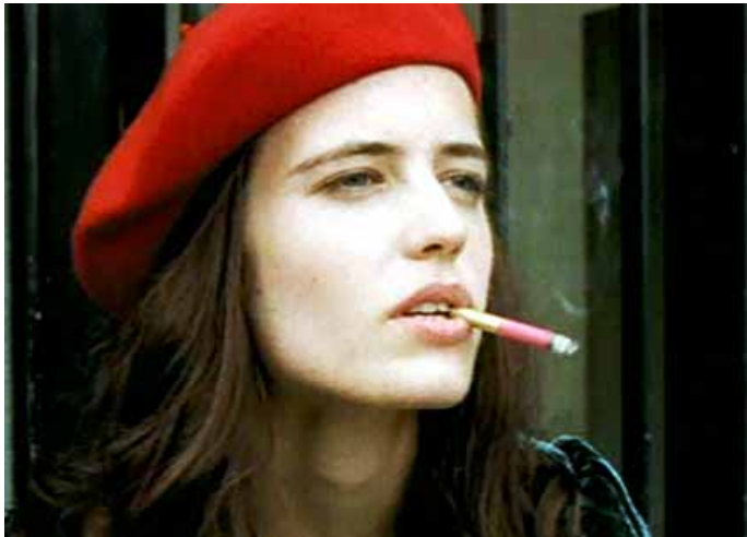
Da /Aus I sognatori