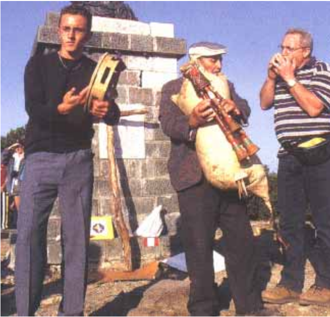
Folclore calabrese - Folklore in Kalabrien

so di abbandono e di disperazione, la sofferenza continua nel cercare di scappare dall'abbruttimento del lavoro